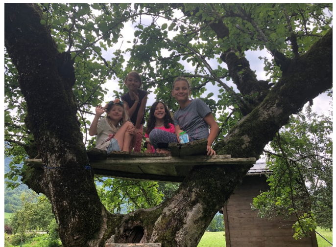
Les enfants se protègent des bêtes sauvages !!