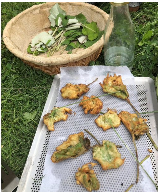
Beignets de tussilage